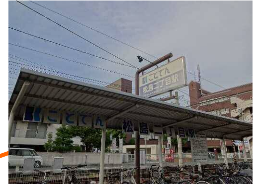
コトデン松島二番町駅