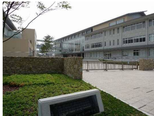
高松第一小学校・中学校